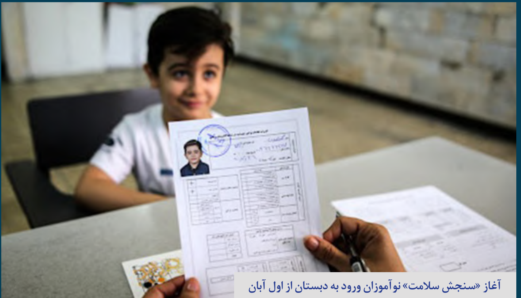
آغاز «سنجش سلامت» نوآموزان ورود به دبستان از اول آبان