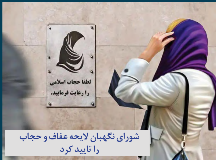
شورای نگهبان لایحه عفاف و حجاب را تایید کرد

شنبه ۲۸ مهرماه ۱۴۰۳ سال ششم www.avayedarya.ir