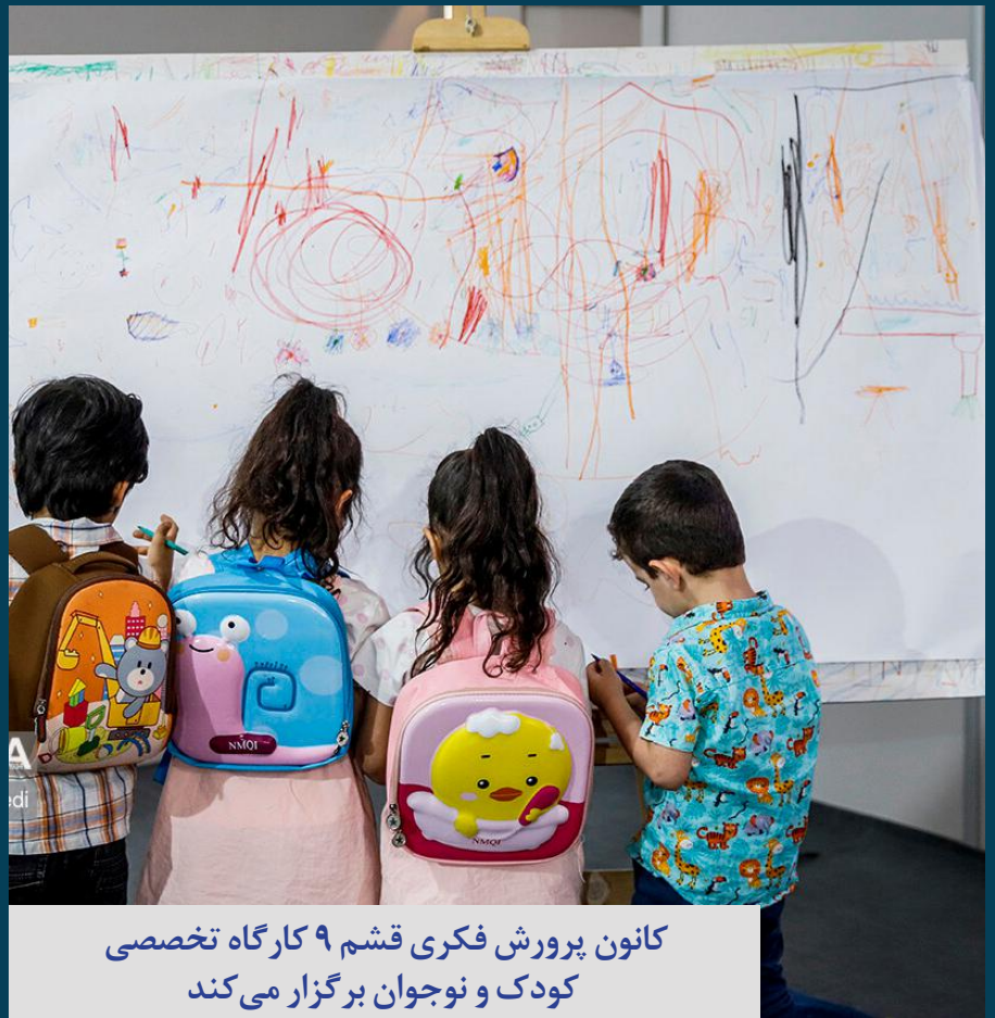
کانون پرورش فکری قشم ۹ کارگاه تخصصی کودک و نوجوان برگزار می کند