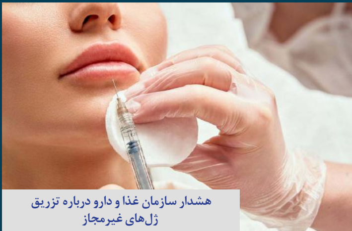
هشدار سازمان غذا و دارو درباره تزریق ژل های غیرمجاز

صدای زنان هرمزگان آوای دریا هفته نامه الکترونیکی هرمزگان