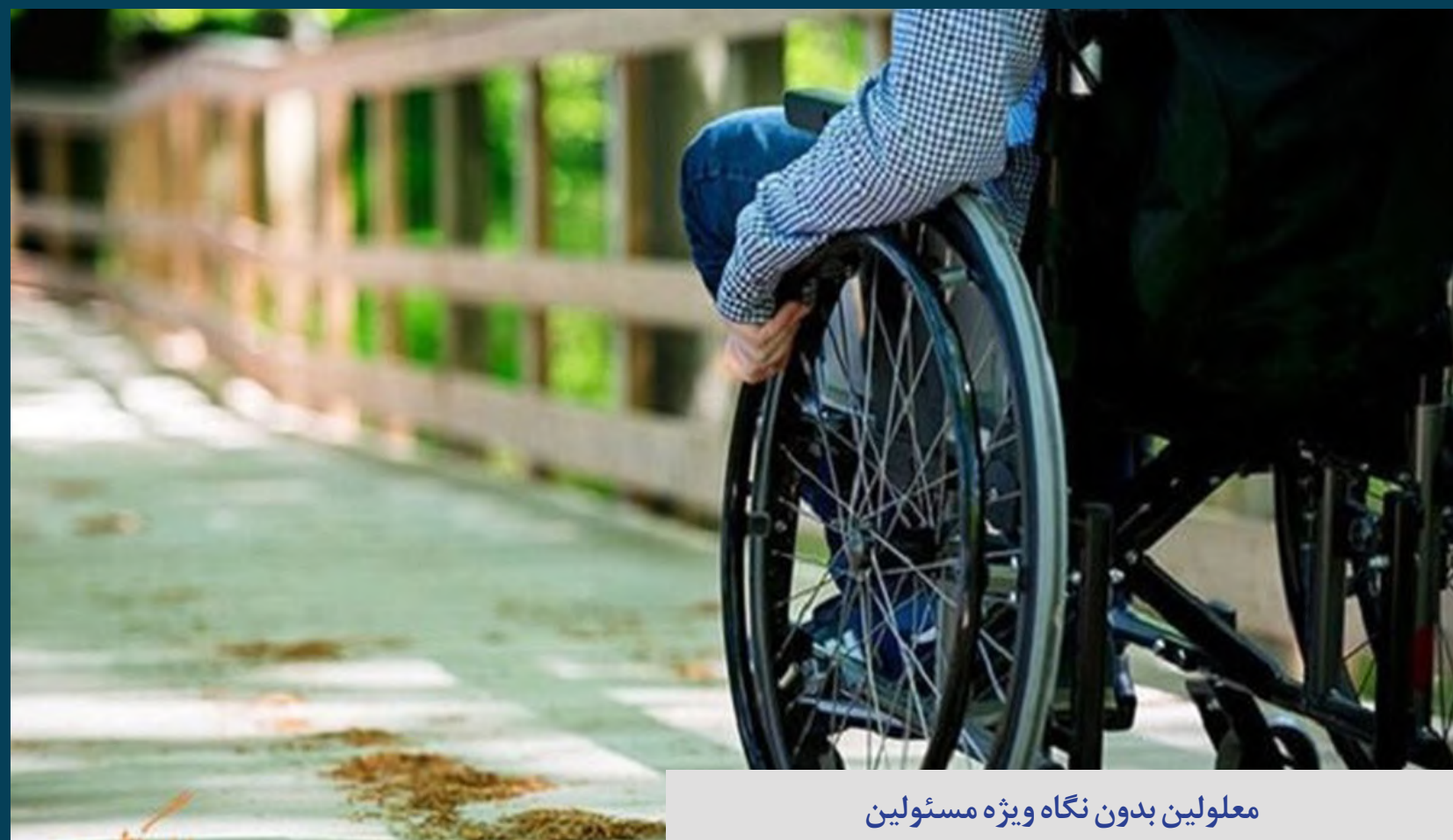
معلولین بدون نگاه ویژه مسئولین