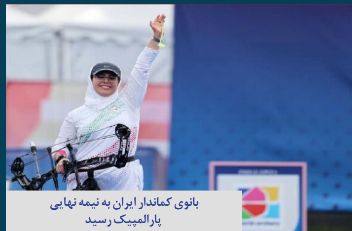
بانوی کماندار ایران به نیمه‌نهایی پارالمپیک رسید

صدای زنان هرمزگان آوای دریا هفته نامه الکترونیکی هرمزگان