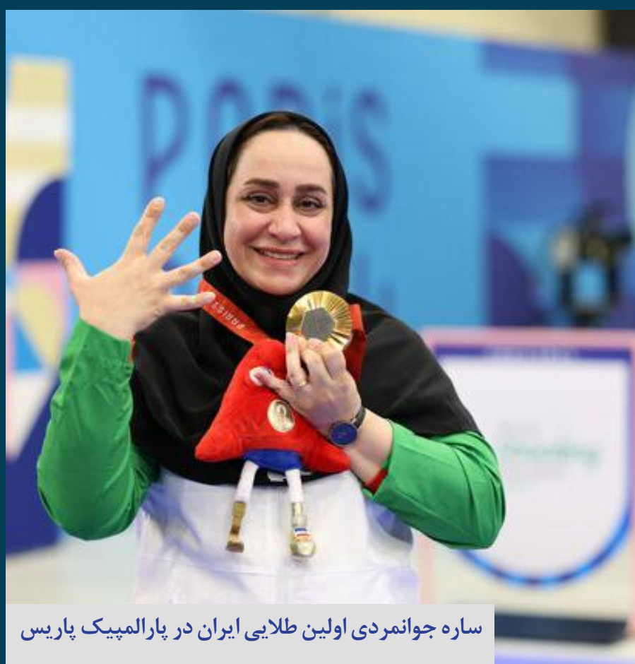
ساره جوانمردی اولین طلایی ایران در پارالمپیک پاریس