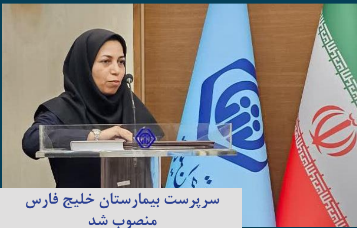
سرپرست بیمارستان خلیج فارس منصوب شد