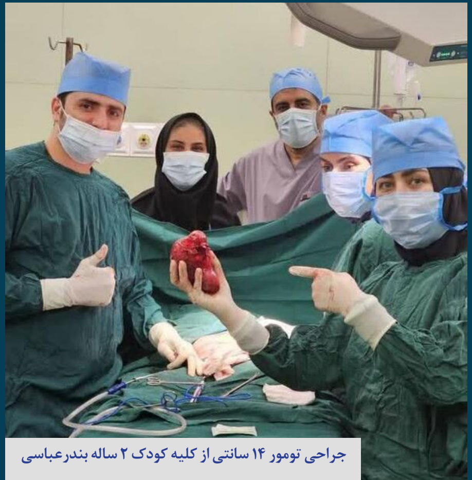
جراحی تومور ۱۴ سانتی از کلیه کودک ۲ ساله بندرعباسی