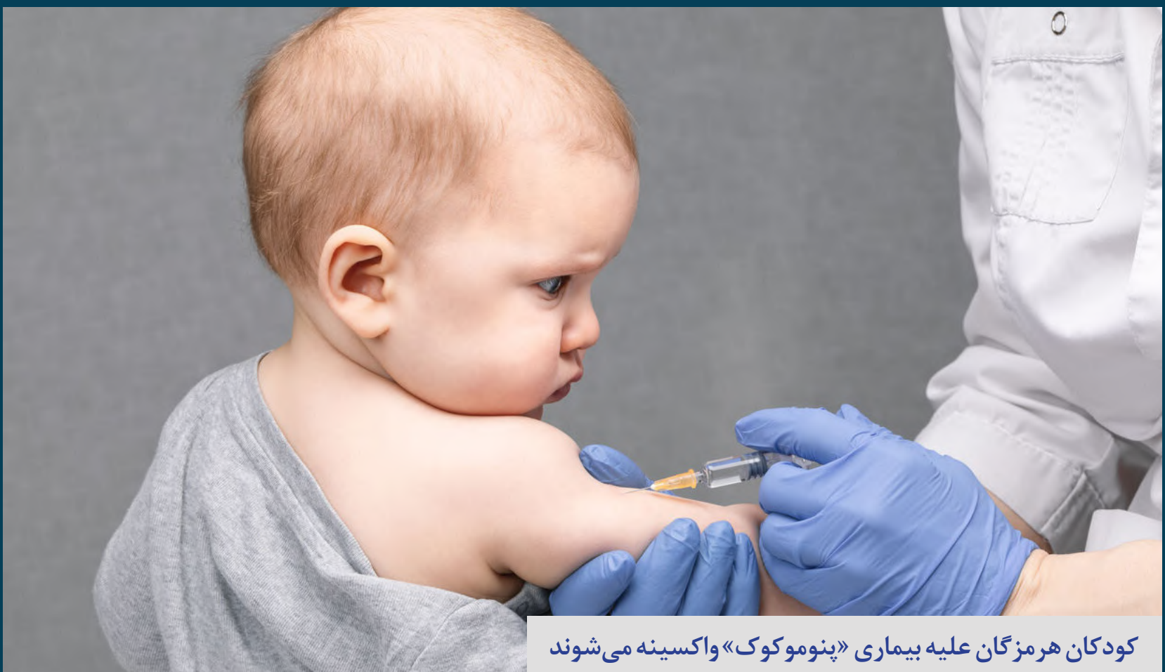
کودکان هرمزگان علیه بیماری «پنوموکوک» واکسینه می شوند