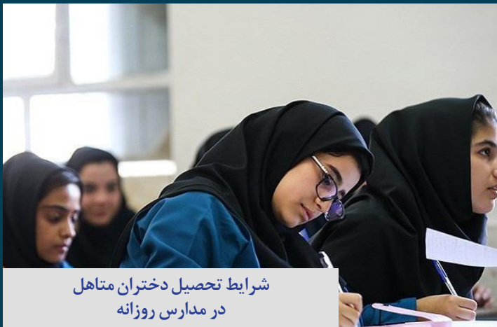
شرایط تحصیل دختران متاهل در مدارس روزانه

صدای زنان هرمزگان آوای دریا هفته نامه الکترونیکی هرمزگان