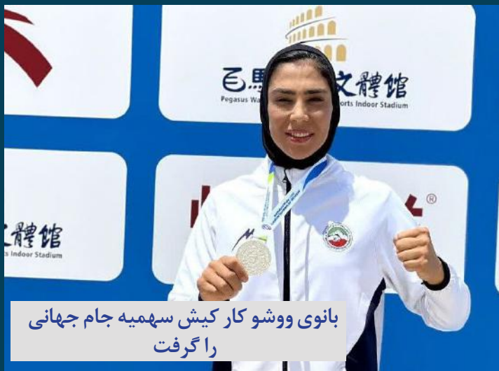
بانوي ووشو کار کيش سهميه جام جهاني را گرفت

شنبه ۰۸ اردیبهشت ماه ۱۴۰۳ سال پنجم www.avayedarya.ir