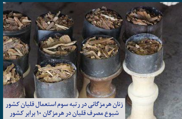
زنان هرمزگانی در رتبه سوم استعمال قلیان کشور شیوع مصرف قلیان در هرمزگان ۱۰ برابر کشور

صدای زنان هرمزگان آوای دریا هفته نامه الکترونیکی هرمزگان