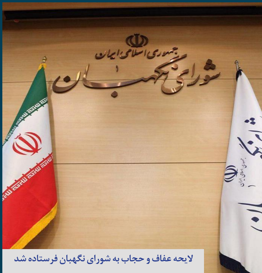
لایحه عفاف و حجاب به شورای نگهبان فرستاده شد