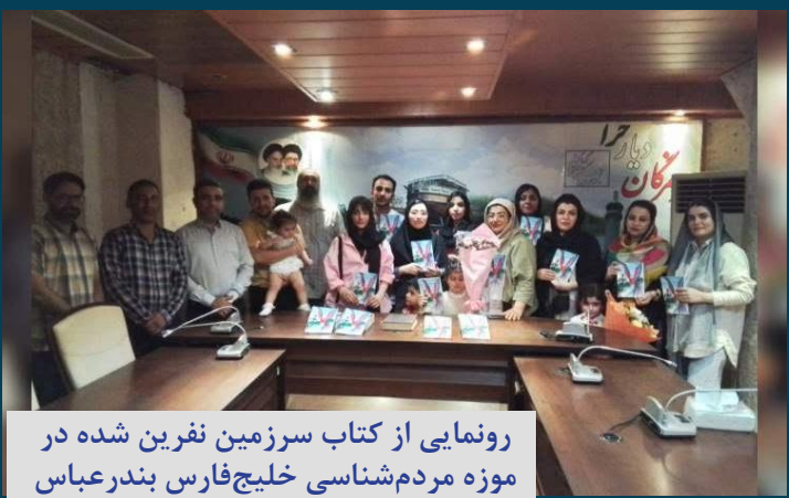
رونمایی از کتاب سرزمین نفرین شده در موزه مردم شناسی خلیج فارس بندرعباس