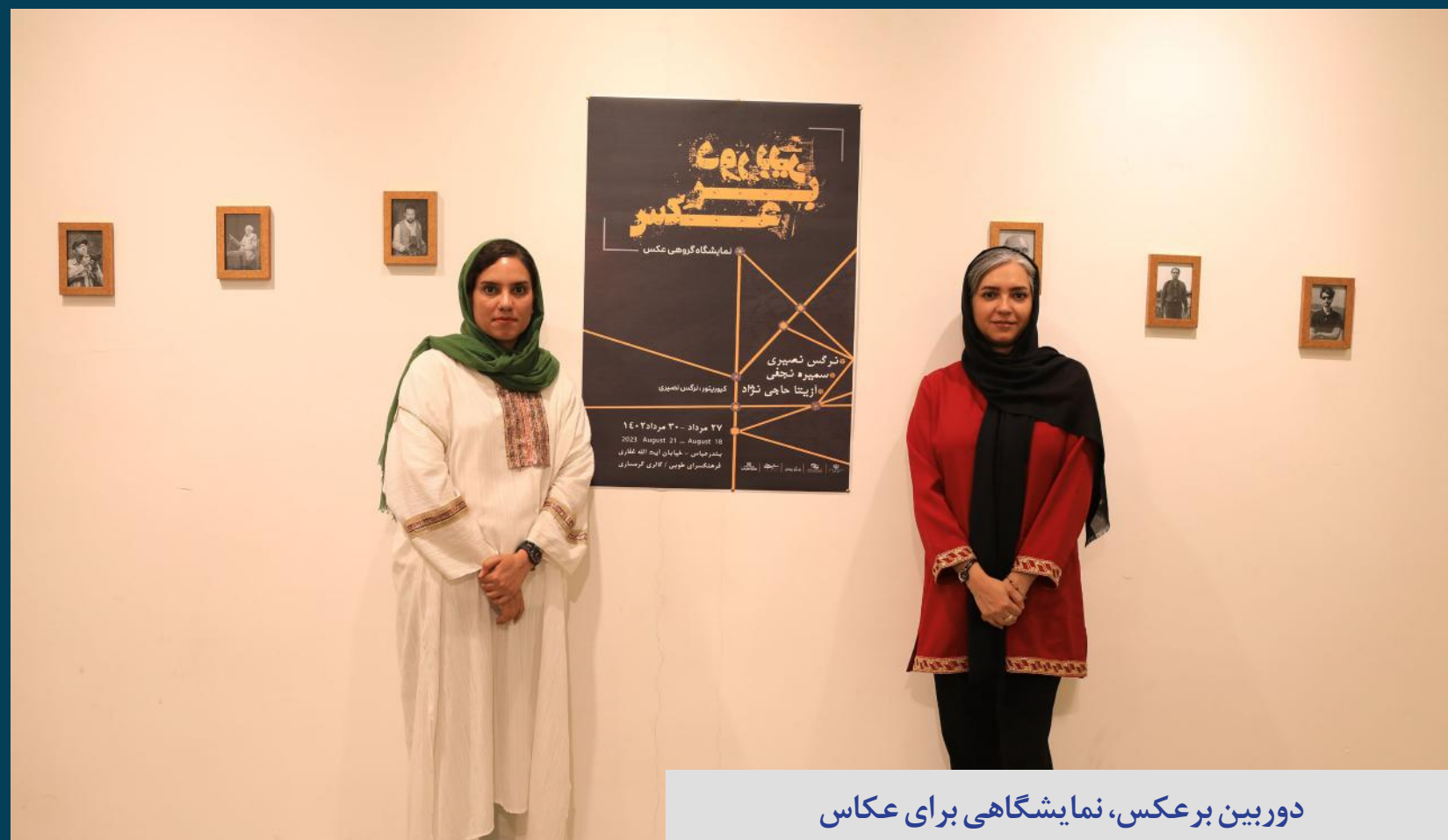
دوربین برعکس، نمایشگاهی برای عکاس