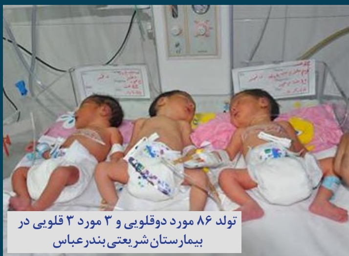
تولد ۸۶ مورد دوقلویی و ۳ مورد ۳ قلویی در بیمارستان شریعتی بندرعباس

شنبه ۰۸ بهمن ماه ۱۴۰۱ سال چهارم www.avayedarya.ir