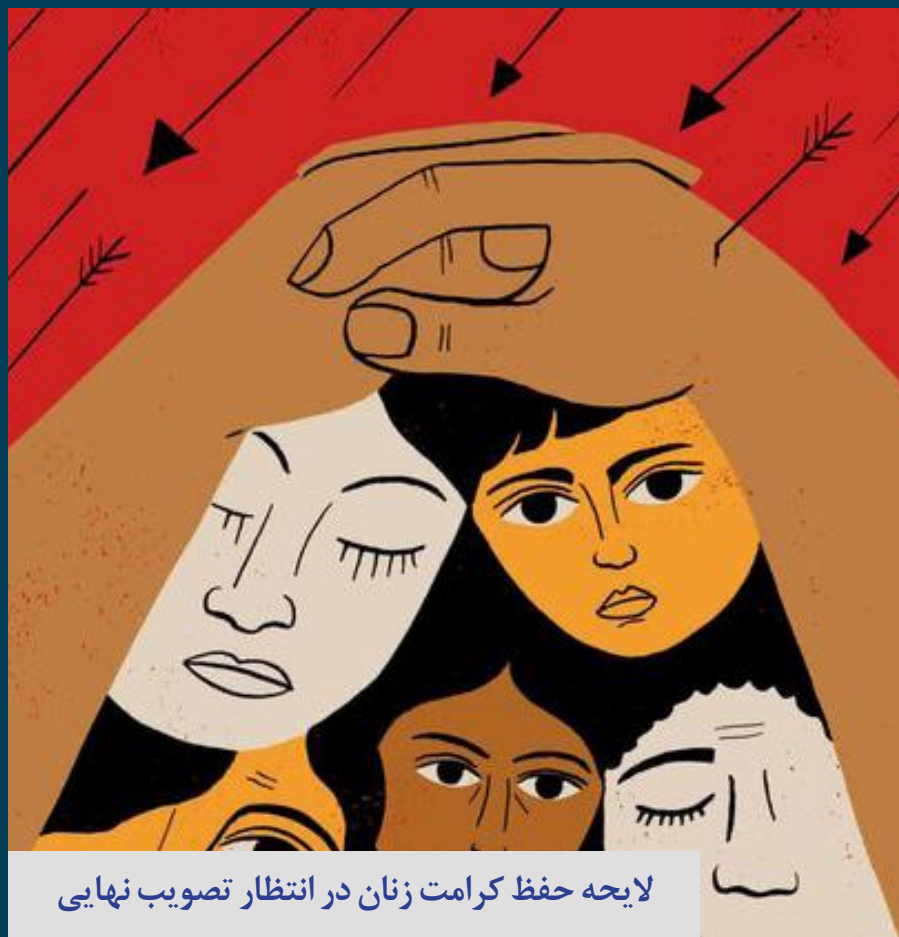
لایحه حفظ کرامت زنان در انتظار تصویب نهایی