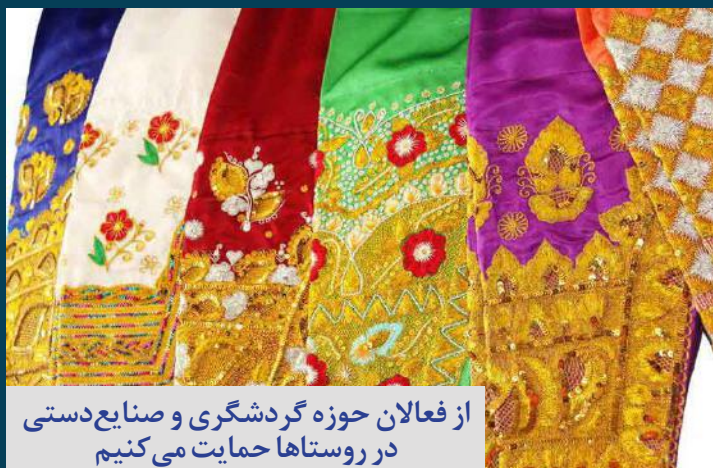
از فعالان حوزه گردشگری و صنایع دستی در روستاها حمایت می‌کنیم

صدای زنان هرمزگان آوای دریا هفته نامه الکترونیکی هرمزگان