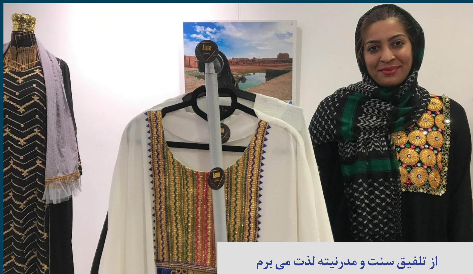
از تلفیق سنت و مدرنیته لذت می‌برم