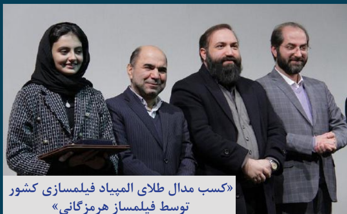
«کسب مدال طلای المپیاد فیلمسازی کشور توسط فیلمساز هرمزگانی»