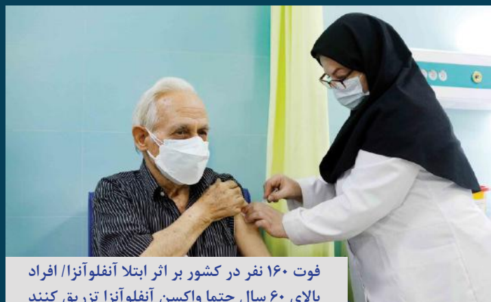
فوت ۱۶۰ نفر در کشور بر اثر ابتلا آنفلوآنزا/ افراد بالای ۶۰ سال حتما واکسن آنفلوآنزا تزریق کنند