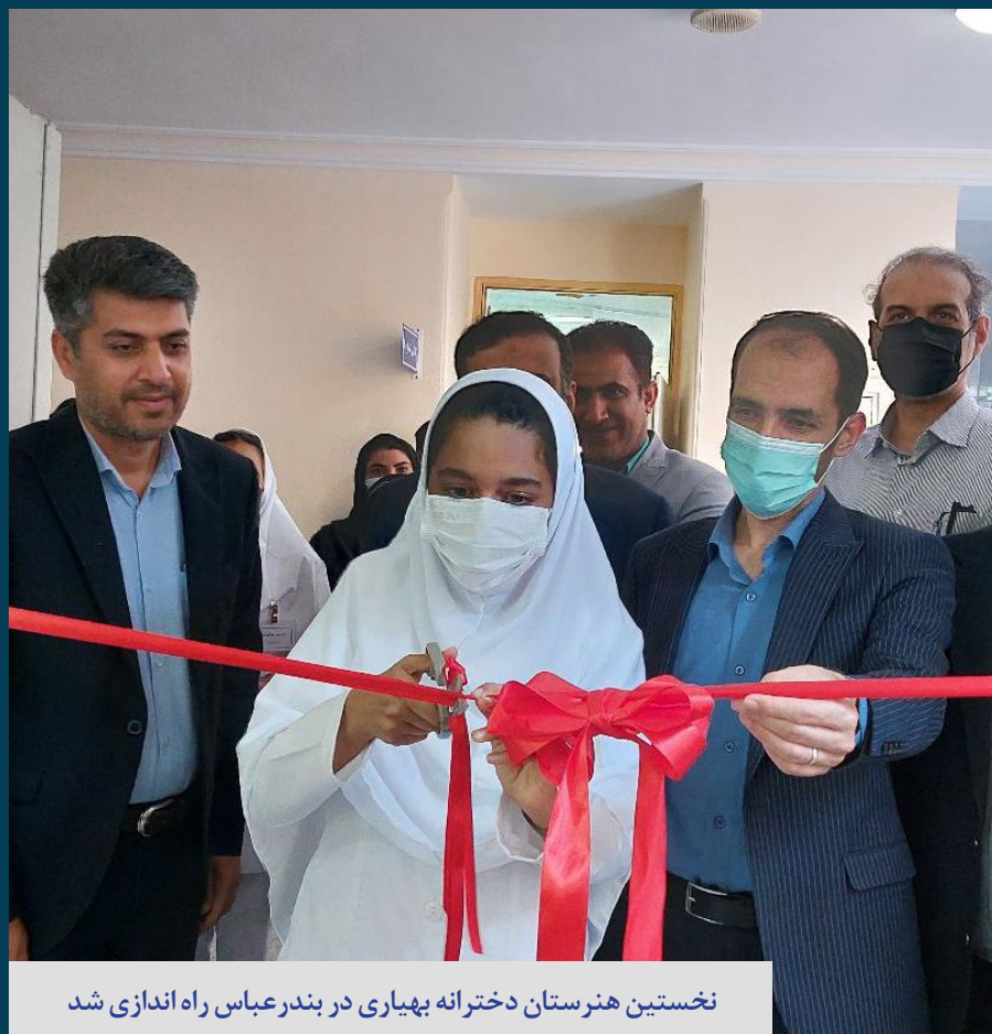
نخستین هنرستان دخترانه بهیاری در بندرعباس راه اندازی شد