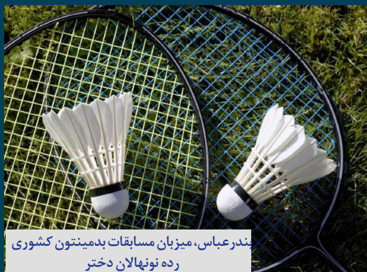
بندرعباس، میزبان مسابقات بدمینتون کشوری رده نونهالان دختر

صدای زنان هرمزگان آوای دریا هفته نامه الکترونیکی هرمزگان