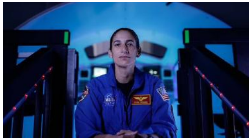
"یاسمین مقبلی" (Jasmin Moghbeli)