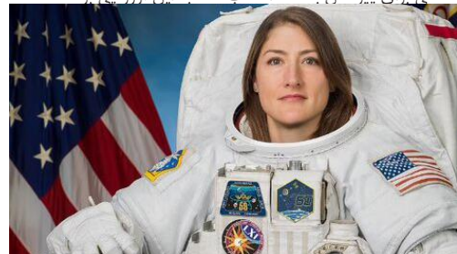
کریستینا کخ (Christina Koch) زادگاه: گرندریپدز، میشیگان سن: ۴۳ سال مدت زمان سپری کرده در فضا: ۳۲۸ روز و ۱۳ ساعت و ۵۸ دقیقه

بارون در ماه مارس سال جاری و پس از گذراندن تقریباً ۱۷۷ روز در مدار، به زمین بازگشت. او پیشتر درباره آرزوهای آینده خود گفته بود: وقتی شب‌ها بیرون می‌ایستم و ماه را می‌بینم، سعی می‌کنم خودم را تصور کنم که روی ماه ایستاده‌ام و به زمین نگاه می‌کنم.