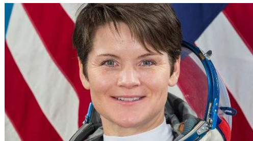
"آن مک‌کلین" (Anne McClain)

روبینز در جدیدترین سفر خود به ایستگاه فضایی بین‌المللی، روی یک آزمایش قلبی کار کرد تا بررسی کند که تغییرات گرانج چگونه بر سلول‌های قلبی-عروقی در سطوح سلولی و بافتی تأثیر می‌گذارد.