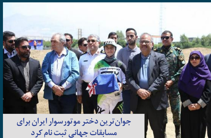
جوان ترین دختر موتورسوار ایران برای مسابقات جهانی ثبت نام کرد

صدای زنان هرمزگان آوای دریا هفته نامه الکترونیکی هرمزگان