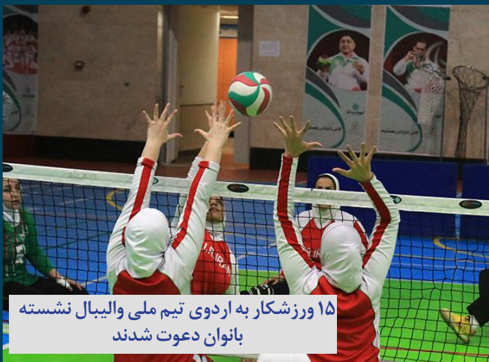
۱۵ ورزشکار به اردوی تیم ملی والیبال نشسته بانوان دعوت شدند

شنبه ۲۲ مردادماه ۱۴۰۱ سال چهارم www.avayedarya.ir