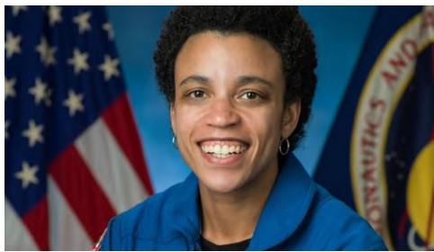
جسیکا واتکینز " (Jessica Watkins)

نتایج پژوهش‌های او می‌تواند درک جدیدی را در مورد مشکلات قلبی در زمین ارائه دهند، به شناسایی درمان‌های جدید کمک کنند و به حمایت از توسعه معیارهای غربالگری برای پیش‌بینی خطرات قلبی-عروقی پیش از پرواز فضایی بپردازند.