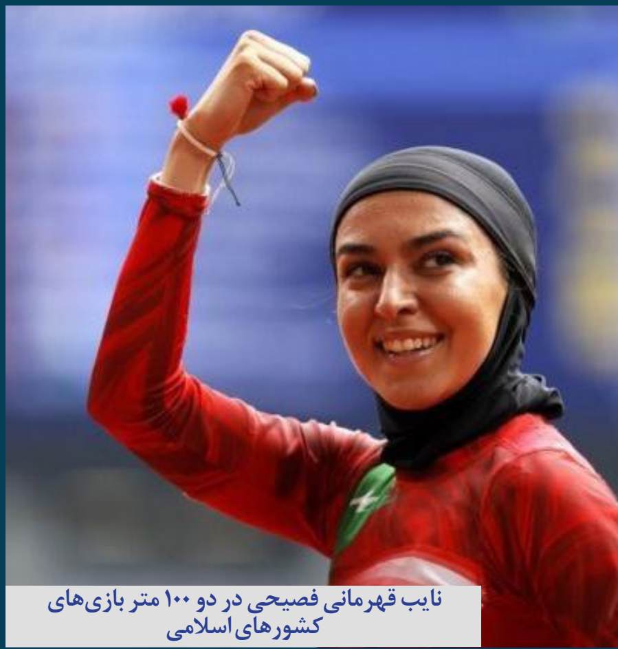
نایب قهرمانی فسیحی در دو ۱۰۰ متر بازی های کشورهای اسلامی