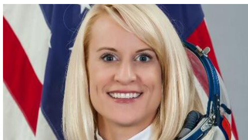
"کیت روبینز" (Kate Rubins)

روای مقبلی برای فضانورد شدن به کلاس ششم بازمی‌گردد؛ زمانی که او گزارشی درباره "والنتینا ترشکوا" (Valentina Tereshkova)، فضانورد روسی و نخستین زن در فضا تهیه کرد. او گفت به خاطر می‌آورد که مادرش در تهیه لباس فضایی به او کمک می‌کرد تا آن را برای ارائه گزارش خود در کلاس ببوشد.