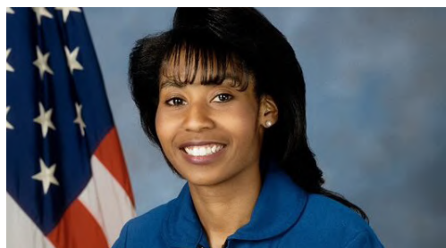
"استفانی ویلسون" (Stephanie Wilson)

همچنین، او تصویری از خود در حال انجام دادن لوله‌کشی فضایی برای تعمیر یک توالیت در ایستگاه فضایی بین‌المللی به اشتراک گذاشت و در توییتی جداگانه اضافه کرد: یکی از بخش‌های مورد علاقه من پیرامون قرار گرفتن در مدار، مشاهده ویژگی‌های زمین‌شناسی روی زمین از منظر سیاره‌ای است.