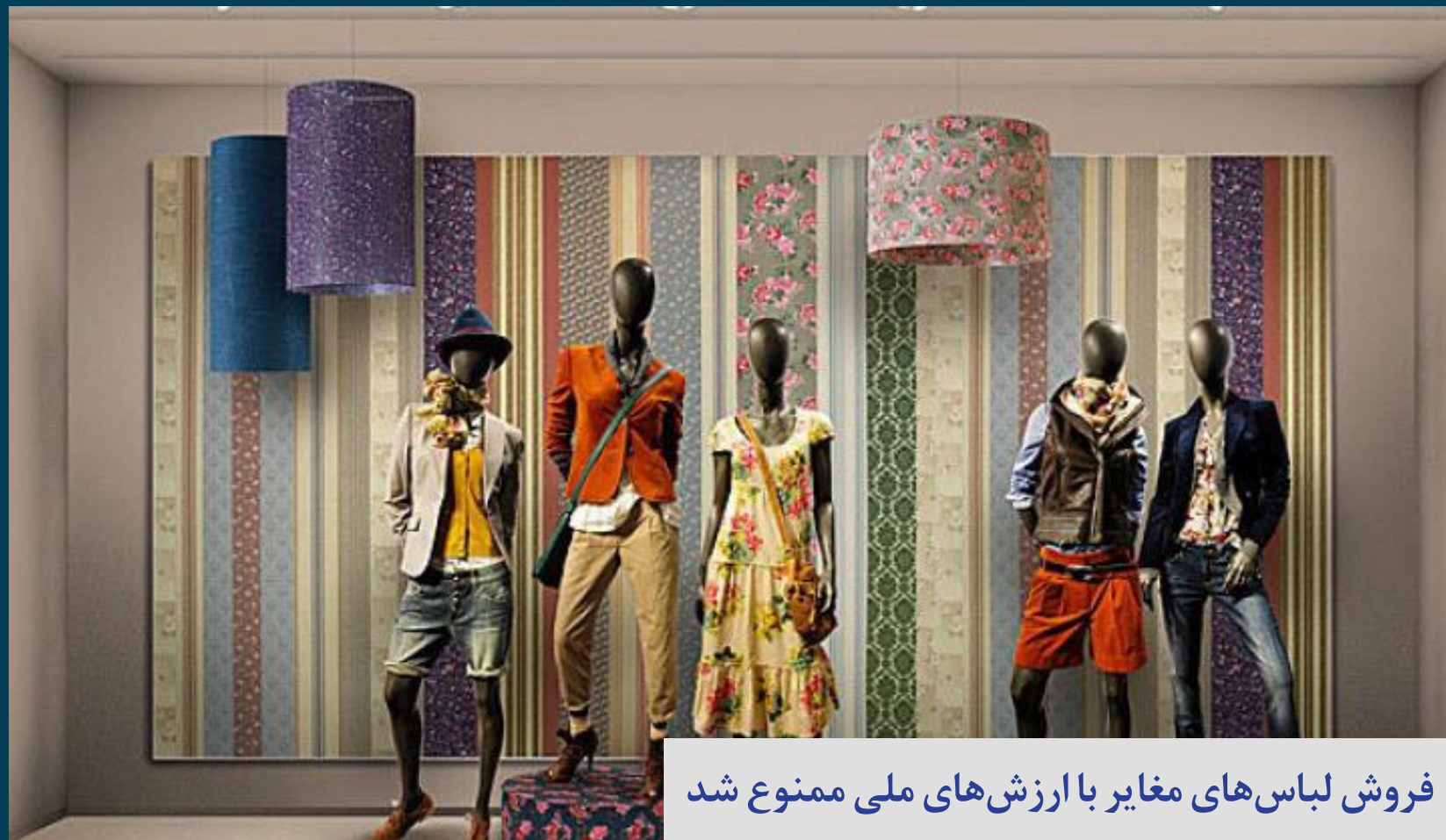
فروش لباس های مغایر با ارزش های ملی ممنوع شد