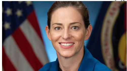
نیکول مان (Nicole Mann) زادگاه: پتالوما، کالیفرنیا سن: ۴۵ سال مدت زمان سپری کرده در فضا: ۰

ناسا فهرستی از ۹ زن را ارائه داده است که احتمالاً فضاورد ماموریت ماه، از میان آنها انتخاب خواهد شد که نام "یاسمین مقبلی"، فضاورد ایرانی نیز در میان آنها دیده می‌شود. در این گزارش، به معرفی این زنان می‌پردازیم. بیش از نیم قرن از نخستین قدم گذاشتن انسان روی ماه می‌گذرد؛ زمانی که "نیل آرمسترانگ" (Neil Armstrong) این کلمات جاودانه را به زبان آورد: "این یک قدم کوچک برای انسان و یک جهش بزرگ برای نوع بشر است."