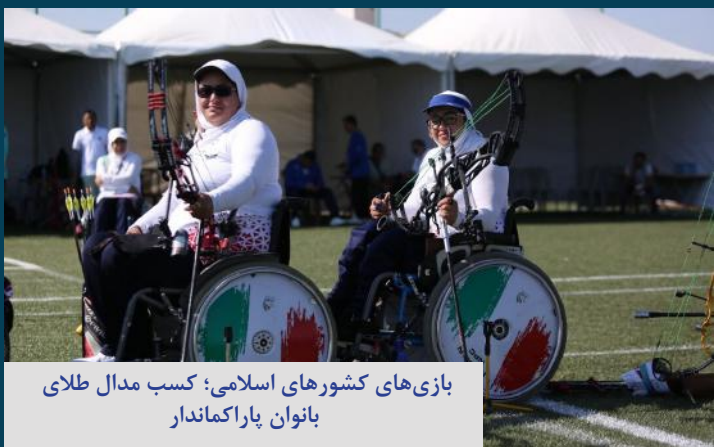
بازی های کشورهای اسلامی؛ کسب مدال طلای بانوان پاراکماندار