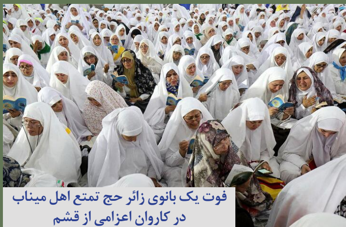
فوت یک بانوی زائر حج تمتع اهل میناب در کاروان اعزامی از قشم

صدای زنان هرمزگان آوای دریا هفته نامه الکترونیکی هرمزگان