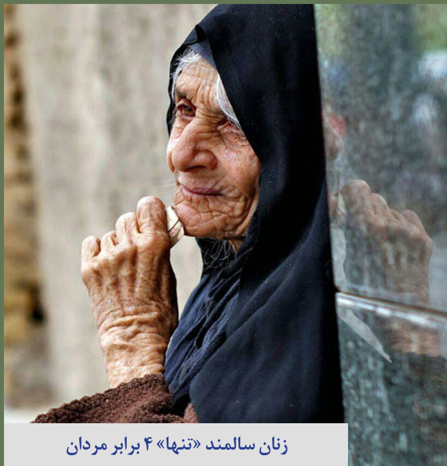
زنان سالمند «تنها» ۴ برابر مردان