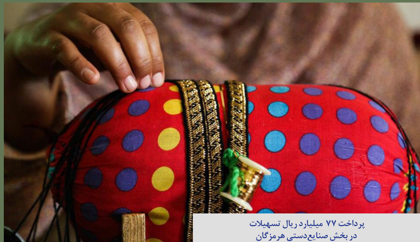
پرداخت ۷۷ میلیارد ریال تسهیلات در بخش صنایع دستی هرمزگان