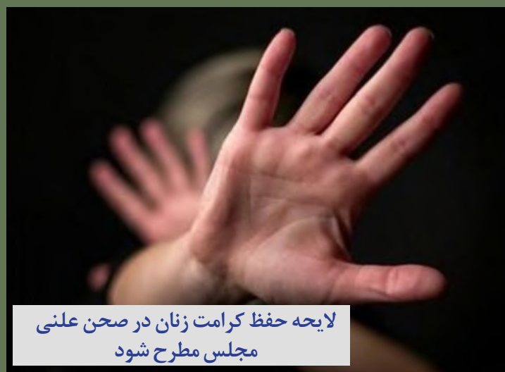
لایحه حفظ کرامت زنان در صحن علنی مجلس مطرح شود

شنبه ۱۱ تیرماه ۱۴۰۱ سال چهارم www.avayedarya.ir