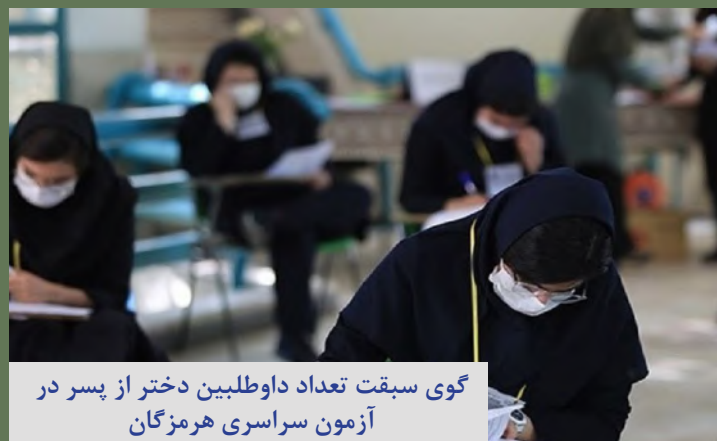
گوی سبقت تعداد داوطلبین دختر از پسر در آزمون سراسری هرمزگان