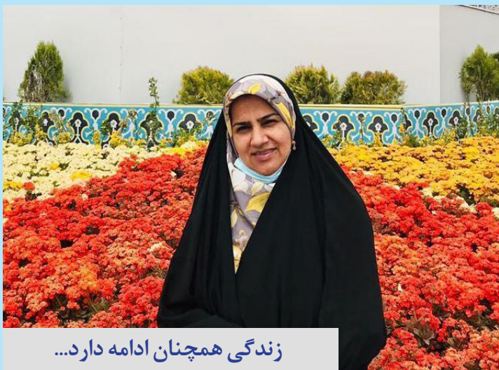
زندگی همچنان ادامه دارد...

شنبه ۲۴ اردیبهشت ۱۴۰۱ سال چهارم www.avayedarya.ir