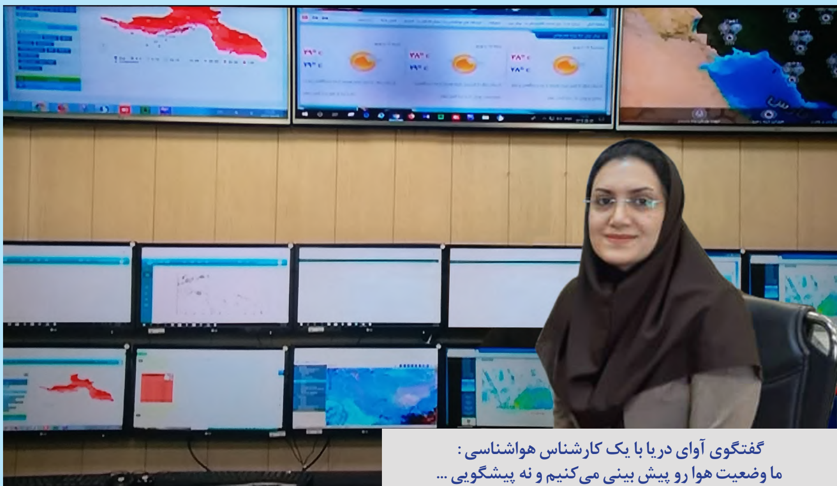
گفتگوی آوای دریا با یک کارشناس هواشناسی: ما وضعیت هوا رو پیش بینی می کنیم و نه پیشگویی ...