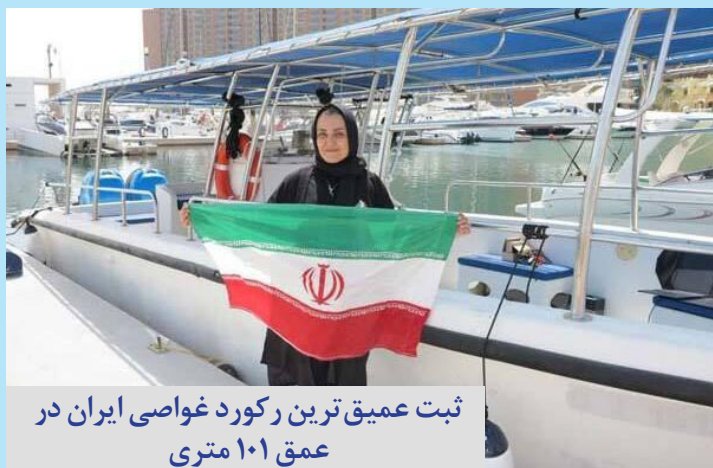
ثبت عمیق ترین رکورد غواصی ایران در عمق ۱۰۱ متری

صدای زنان هرمزگان آوای دریا هفته نامه الکترونیکی هرمزگان