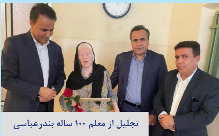
تجلیل از معلم ۱۰۰ ساله بندرعباسی