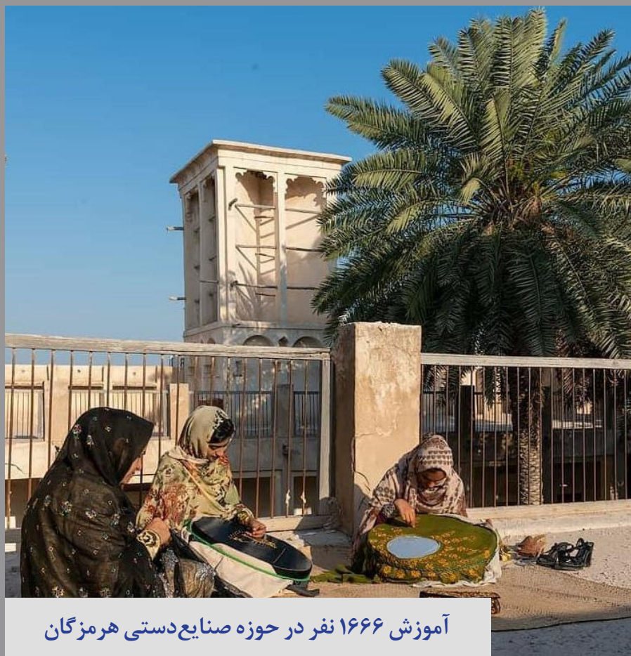
آموزش ۱۶۶۶ نفر در حوزه صنایع دستی هرمزگان