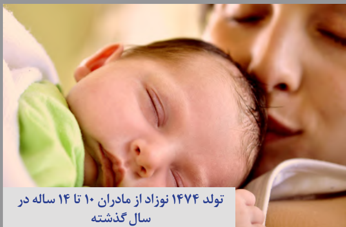
تولد ۱۴۷۴ نوزاد از مادران ۱۰ تا ۱۴ ساله در سال گذشته

صدای زنان هرمزگان آوای دریا هفته نامه الکترونیکی هرمزگان