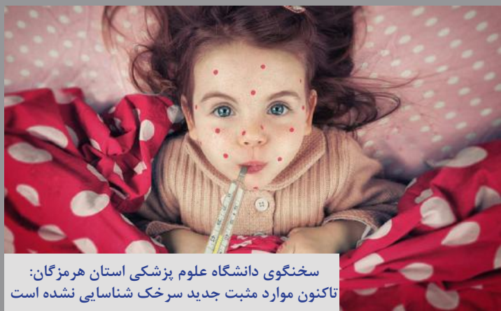
سخنگوی دانشگاه علوم پزشکی استان هرمزگان: تاکنون موارد مثبت جدید سرخک شناسایی نشده است