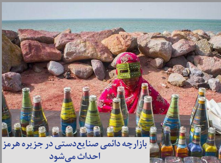
بازارچه دائمی صنایع دستی در جزیره هرمز احداث می شود

شنبه ۲۷ فروردین ۱۴۰۱ سال سوم www.avayedarya.ir