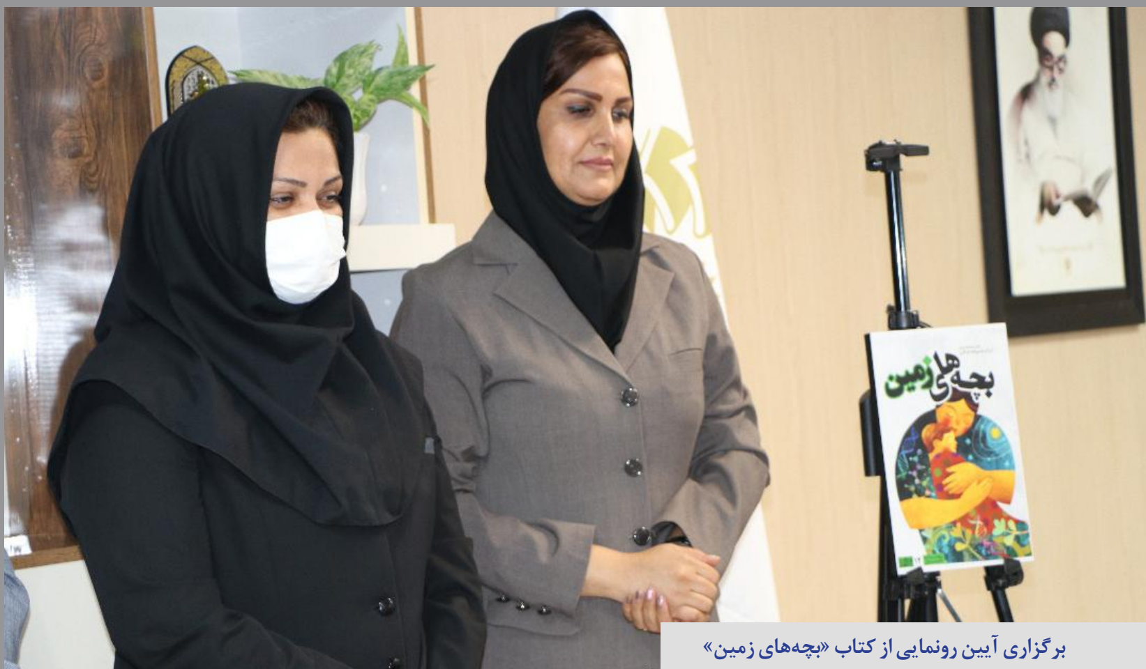
برگزاری آیین رونمایی از کتاب «بچه های زمین»