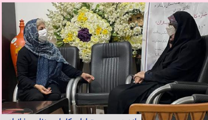
بازدید سرپرست اداره کل امور زنان و خانواده استانداری هرمزگان از همراه سرای سبز

صدای زنان هرمزگان آوای دریا هفته نامه الکترونیکی هرمزگان