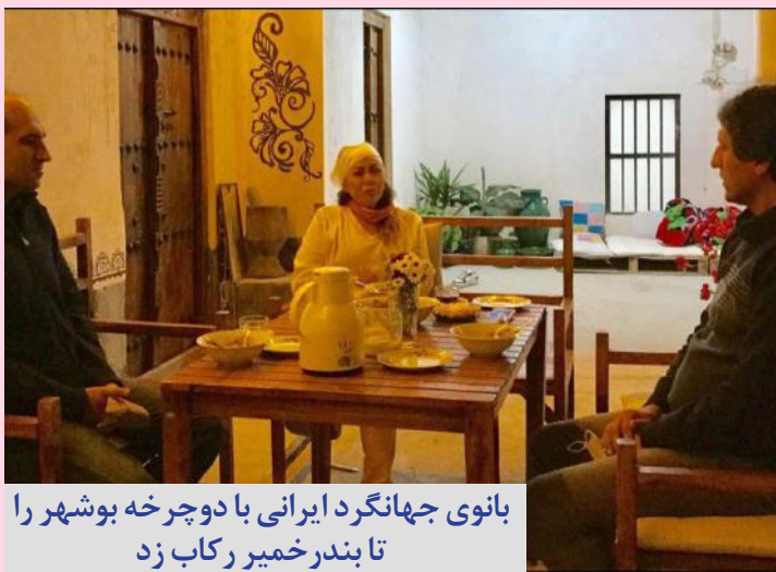
بانوی جهانگرد ایرانی با دو چرخه بوشهر را تا بندر خمیر رکاب زد

شنبه ۰۷ اسفند ۱۴۰۰ سال سوم www.avayedarya.ir