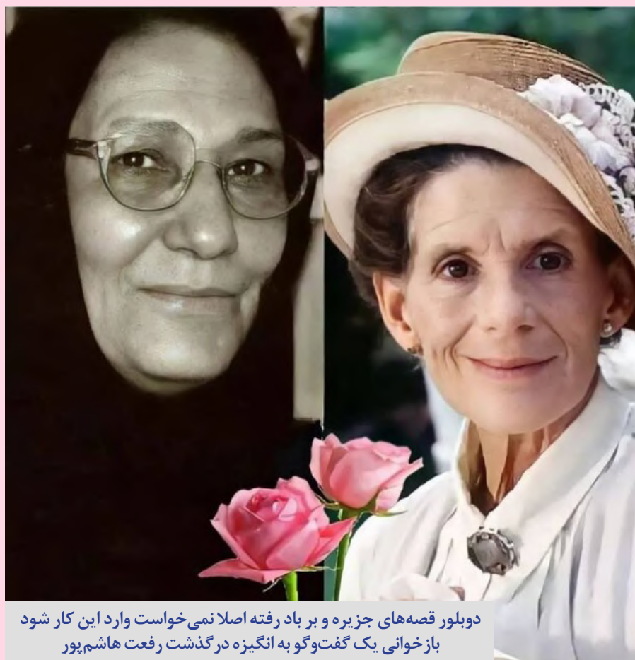
دوبلور قصه‌های جزیره و بر باد رفته اصلا نمی‌خواست وارد این کار شود بازخوانی یک گفت‌وگو به انگیزه در گذشت رفعت هاشم‌پور