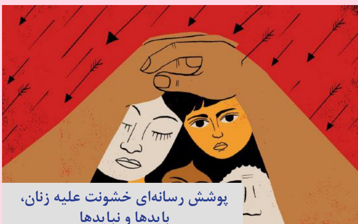
پوشش رسانه‌ای خشونت علیه زنان، بایدها و نبایدها