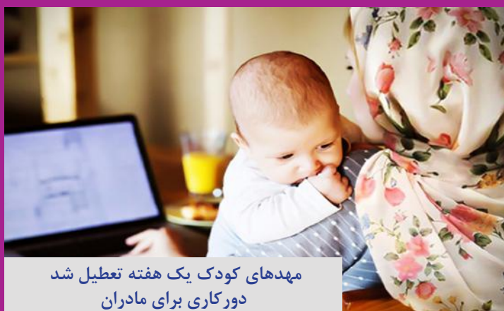
مهدهای کودک یک هفته تعطیل شد دورکاری برای مادران