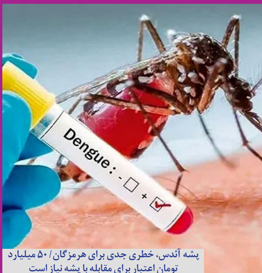
پشه آندس، خطری جدی برای هرمزگان / ۵۰ میلیارد تومان اعتبار برای مقابله با پشه نیاز است