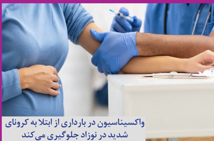
واکسیناسیون در بارداری از ابتلا به کرونای شدید در نوزاد جلوگیری می کند

صدای زنان هرمزگان آوای دریا هفته نامه الکترونیکی هرمزگان