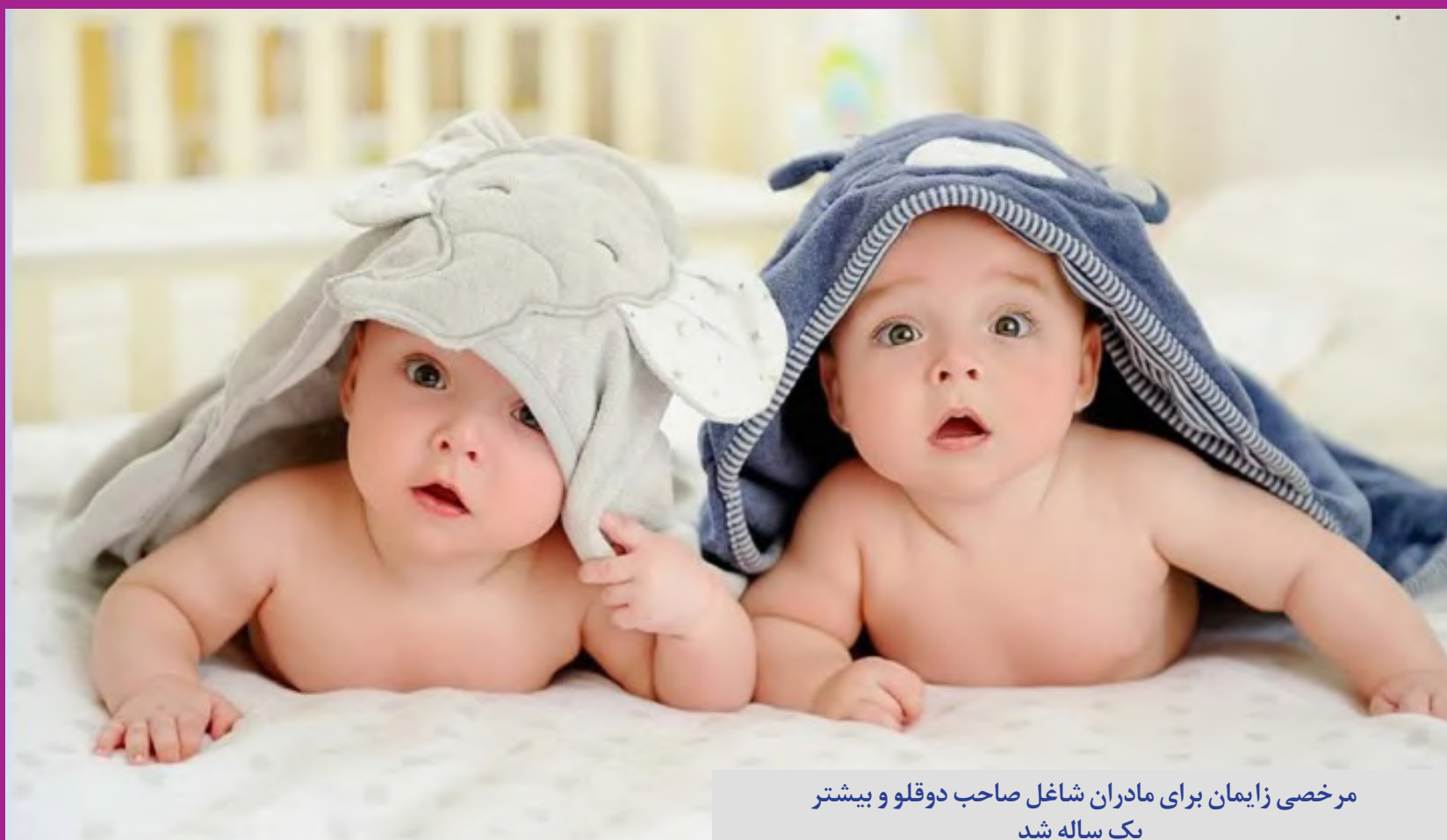
مرخصی زایمان برای مادران شاغل صاحب دوقلو و بیشتر یک ساله شد