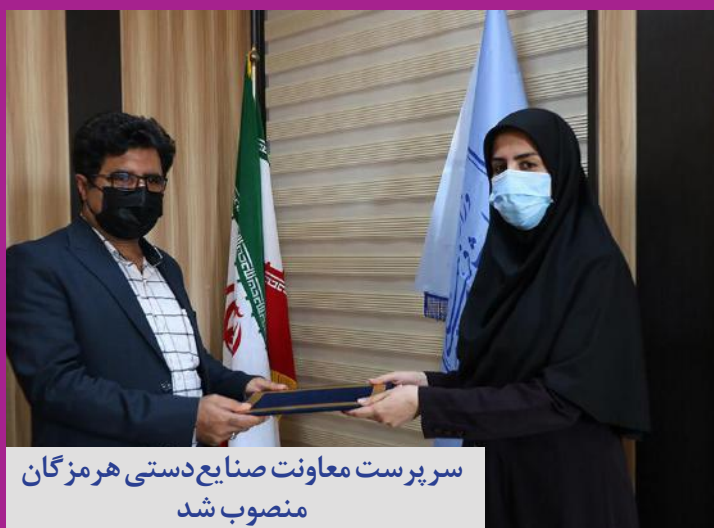
سرپرست معاونت صنایع دستی هرمزگان منصوب شد

شنبه ۳۰ بهمن ۱۴۰۰ سال سوم www.avayedarya.ir