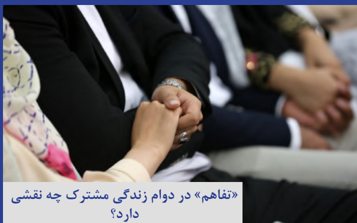
«تفاهم» در دوام زندگی مشترک چه نقشی دارد؟