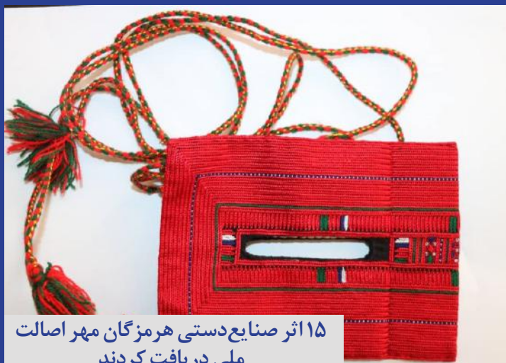
۱۵ اثر صنایع دستی هرمزگان مهر اصالت ملی دریافت کردند

صدای زنان هرمزگان آوای دریا هفته نامه الکترونیکی هرمزگان