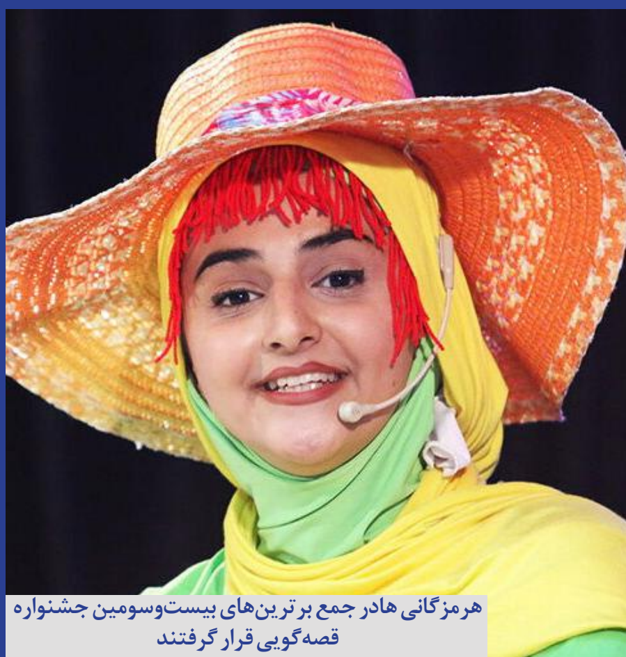
هرمزگانی هادر جمع برترین های بیست و سومین جشنواره قصه گویی قرار گرفتند