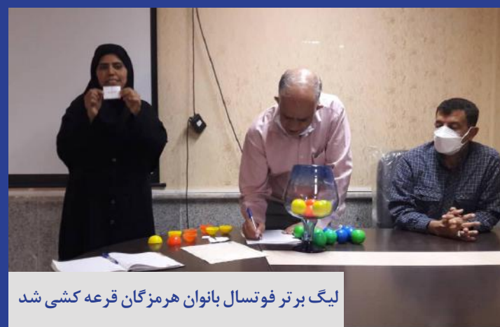
لیگ برتر فوتسال بانوان هرمزگان قرعه کشی شد