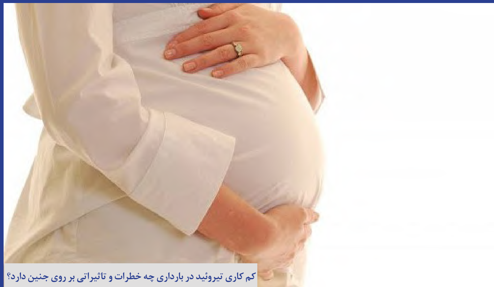
کم کاری تیروئید در بارداری چه خطرات و تاثیراتی بر روی جنین دارد؟