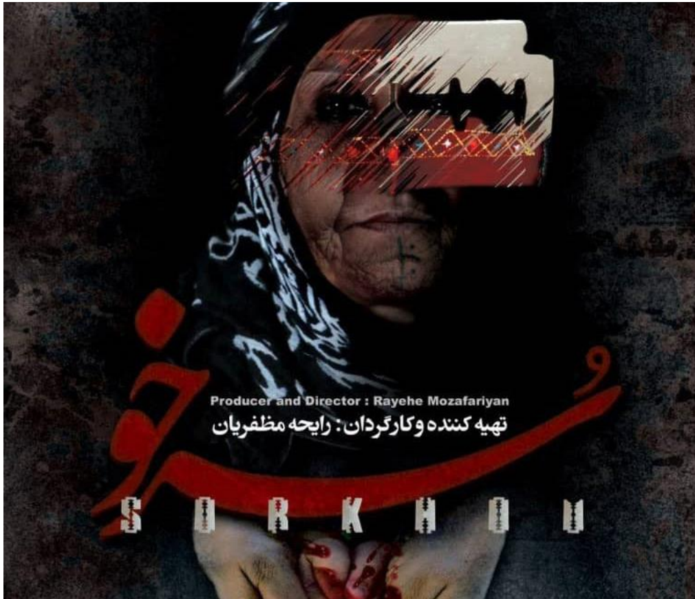
تیه کننده و کارگردان : رایحه مظفریان Producer and Director : Rayehe Mozafariyan

از سرخو بگویند ؟ برای ساخت مستند سرخو ، نمونه هایی را در خارج از ایران دیده بودم. کسانی که در کردستان عراق و مصر فعالیت داشتند و مستندهای می ساختند و خانمی به اسم "جاها" از سومالی که تلاش کرد ختنه دختران کشورش را مورد توجه قرار دهد و ما با هم در کنفرانسی حضور داشتیم و من درباره ختنه دختران در ایران صحبت کردم و ایشان گزارشی کار خودش را دارد و بعدها کاندیدا ی صلح نوبل شد.