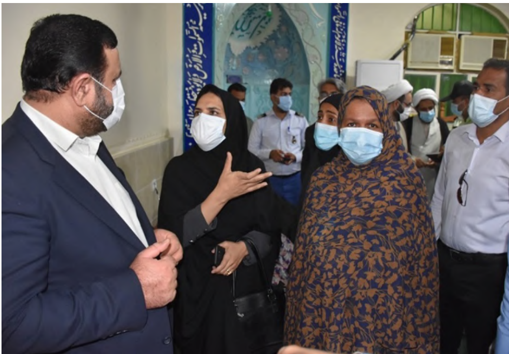
متخلفین برخورد جدی خواهد شد.